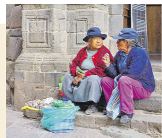
Beschaulichkeit in den Gassen von Cusco. Manchmal fühlt man sich wie auf einer Zeitreise.

Hotels: Natururlaub bietet das Explora Valle Sagrado. Täglich sind geführte Wanderungen oder Fahrradtouren in das Umland (etwa nach Salineras oder Cinco Lagunas) inklusive. Drei Alles-inklusive-Tage kosten in der Öko-Lodge ab 1465 Euro. www.explora.com